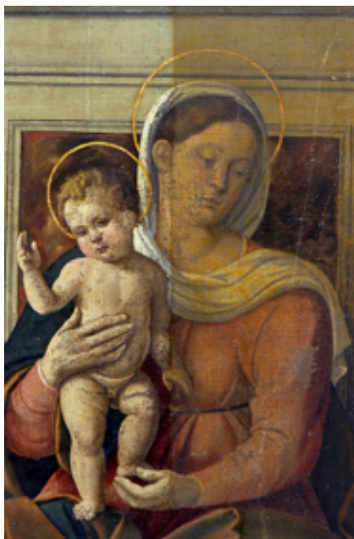
Fig. 5 Particolare durante la pulitura dalle vernici alterate.

Nel restauro precedente, presumibilmente collocabile nella seconda metà dell'Ottocento durante la ristrutturazione della chiesa, sul dipinto venne rimossa la vernice. Le abrasioni del cielo, forse dovute anche ad una eccessiva pulitura, e le lacune delle vesti delle sante furono ritoccate direttamente sul supporto senza stuccature. Una spessa vernice resinosa venne stesa sul dipinto. Il telaio originale, di cui si vedono ancora i segni sulla tela dei rinforzi angolari, venne sostituito con uno nuovo in abete con una traversa mediana e degli incastrati mobili a zeppe angolari.