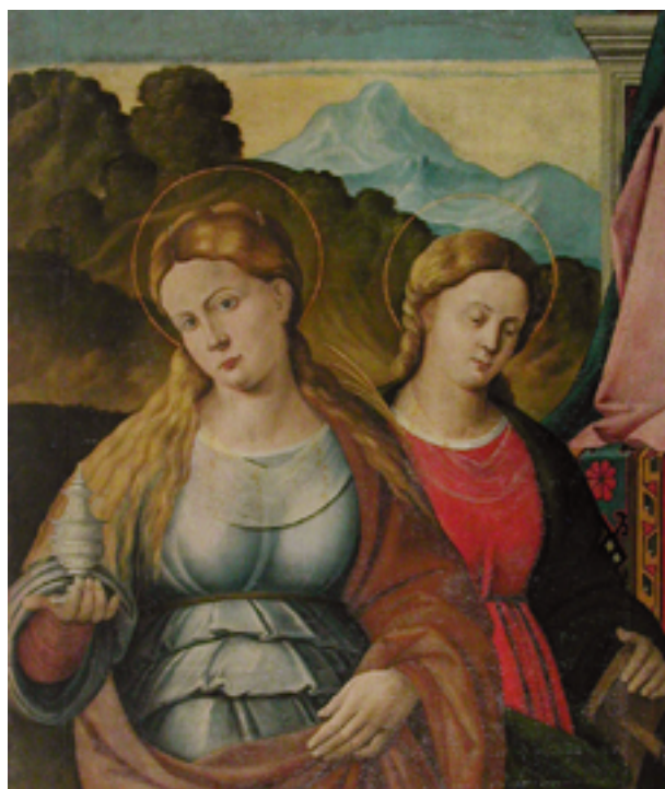
Fig. 3 Capodistria, Chiesa S. Anna, Madonna in trono, particolare con Santa Lucia e Santa Apollonia.